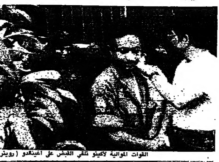
القوات اكينو لاكينو تقلى الجيش على اكينو